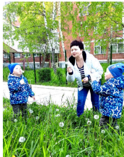
Удивительные цветы, эти одуванчики.

Из этих цветов девочки делают венки, с ними любят играть дети. На днях я наблюдал одну такую игру возле школы, где бабушка учила внуков старой летней забаве. Взяв в руки одуванчики, они загадывали, кто получится «дед» или «баба» и дули, стараясь сдуть весь пух с цветка. Если на одуванчике ничего не остается, значит – «дед», а если остался хоть один белый волосок – «баба». Дети в этот момент не думали об игровой приставке или смартфоне, они наслаждались игрой на свежем воздухе.